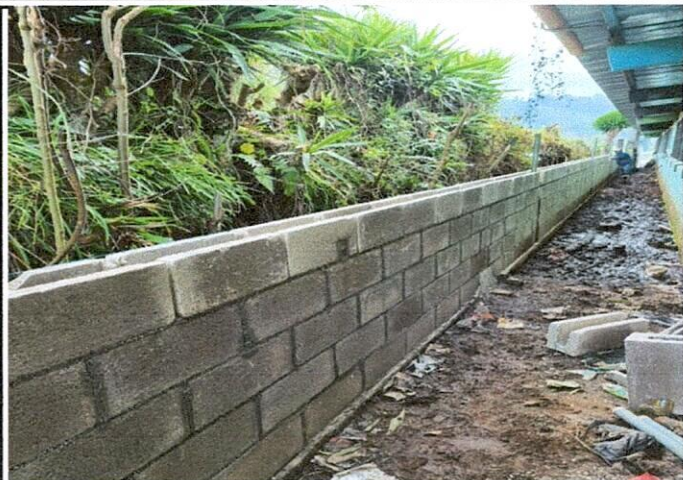
Foto 2: Reparación del muro perimetral con block y malla metálica